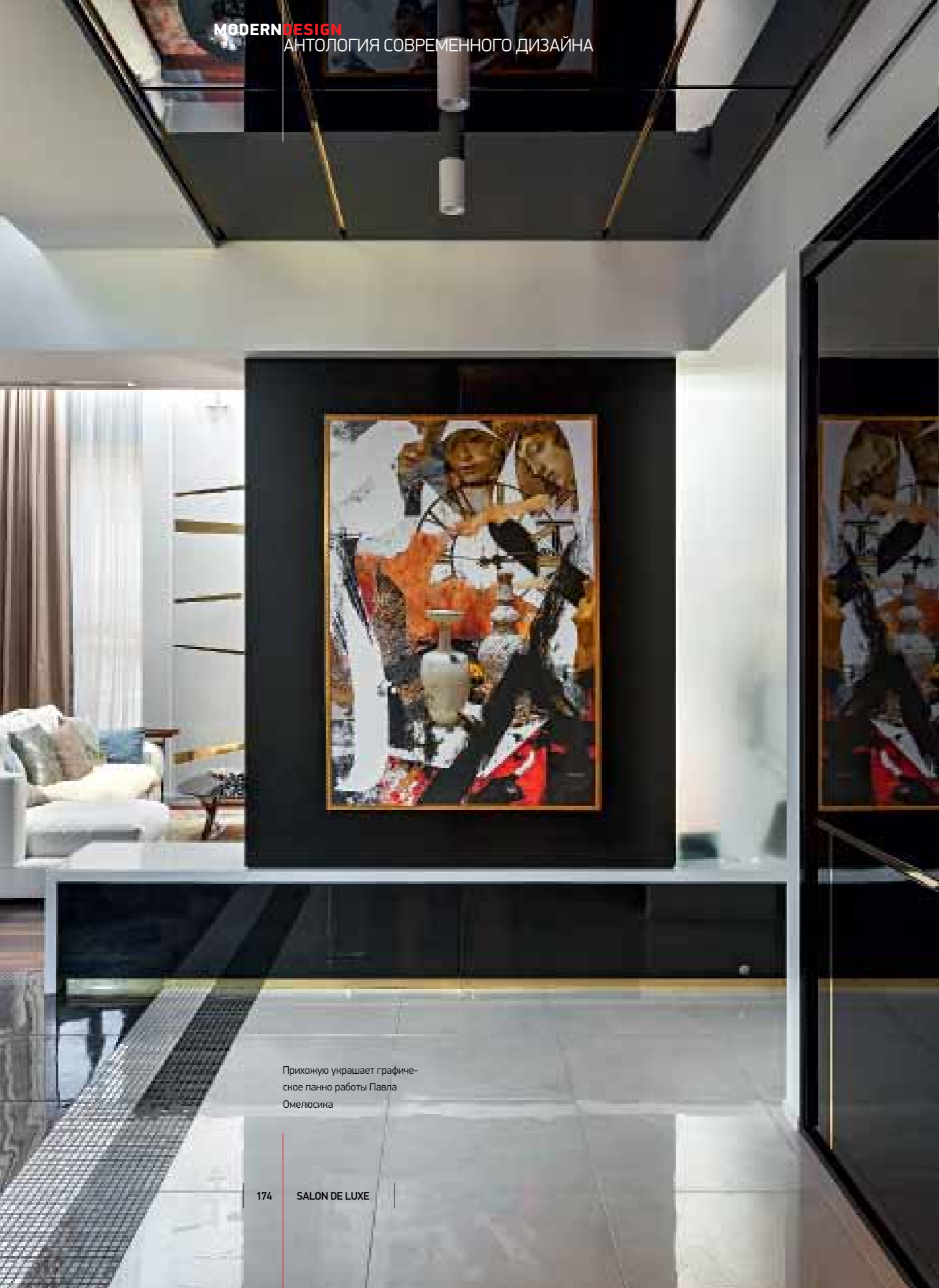
Прихожую украшает графическое панно работы Павла Омелюсика