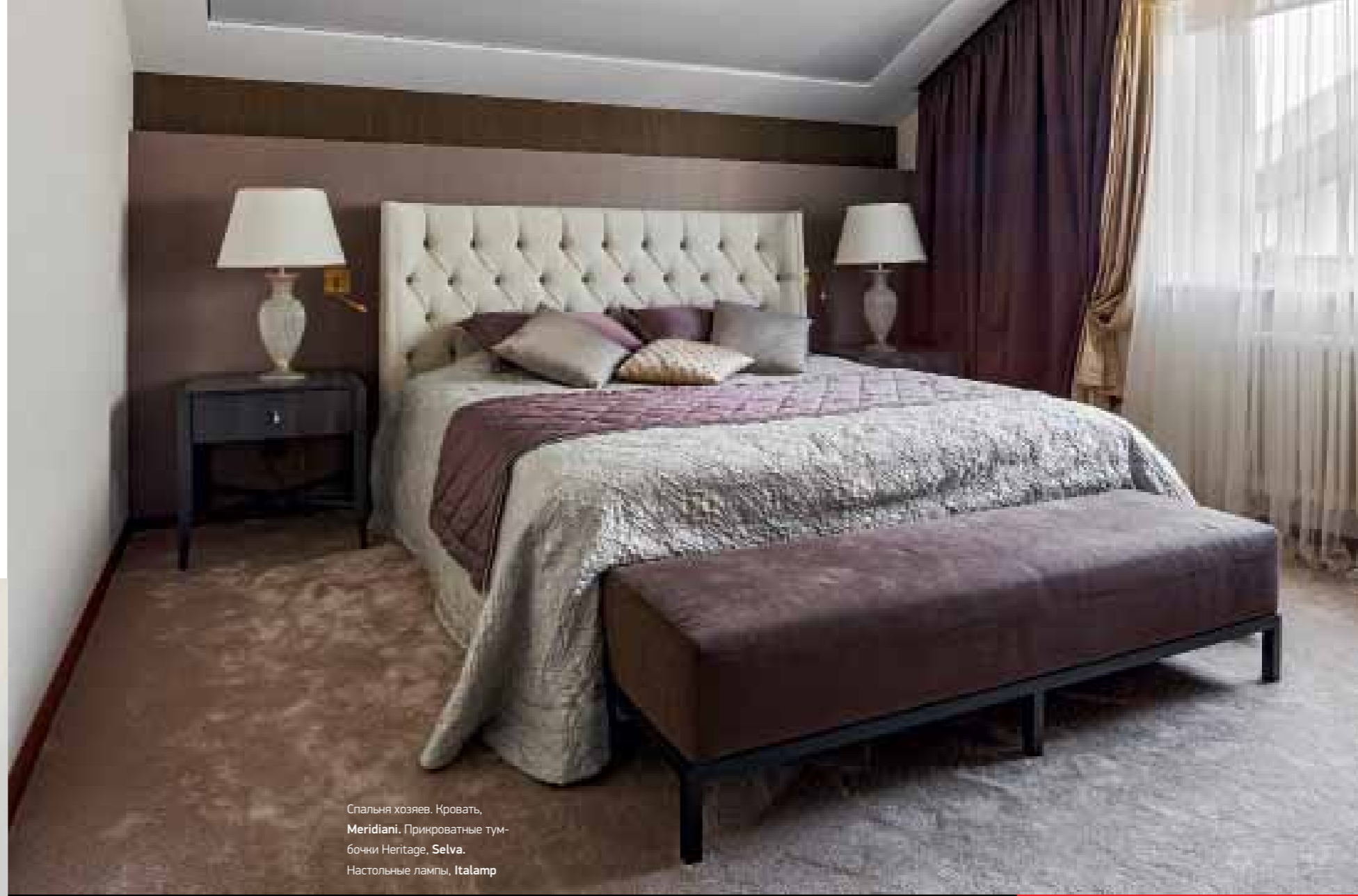
Спальня хозяев. Кровать, Meridiani. Прикроватные тумбочки Heritage, Selva. Настольные лампы, Italamp

Автор проекта: дизайнер Максим Максименко (студия архитектуры и интерьера Nota Bene, г. Минск) Общая площадь 300 м 2